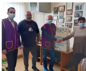
ЛК В.Търново дариха хигиенни материали на SOS детски селища