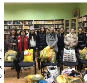
Денят против насилието в училище отбелязаха Лайънс и Лео от Бургас, Свиленград и Русе