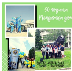
ЛК Пазарджик-Тракия успешно партнира с Младежки Дом и дари дискове за дейността на Апостола