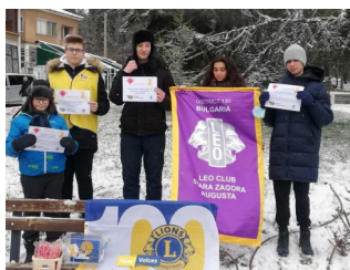
Лео и Лайънс Ст.Загора Августа в помощ на деца с тумори раздаваха балони, сърца и мартенички и дариха игри за педиатрични отделения в Пловдив и Ст.Загора