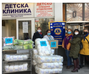
ЛК Пловдив-Евридика дари хигиенни материали на Детска клиника